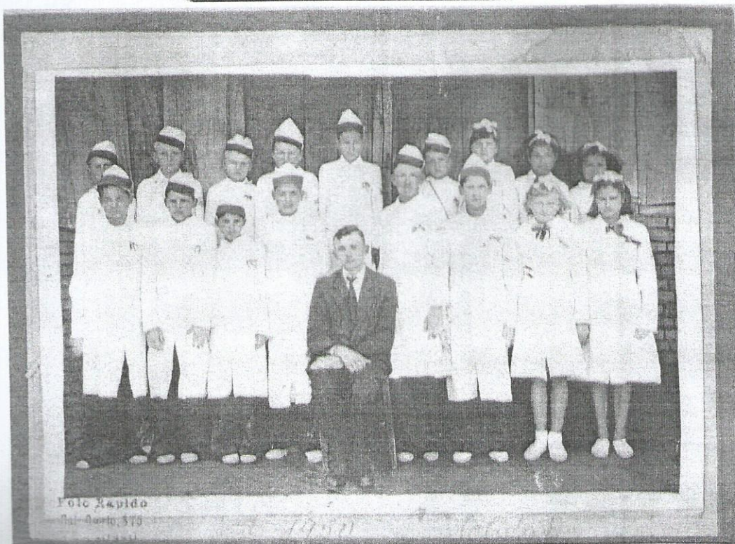
Primeira turma de alunos em 1950.

A handwritten signature in blue ink, located in the bottom right corner of the page.