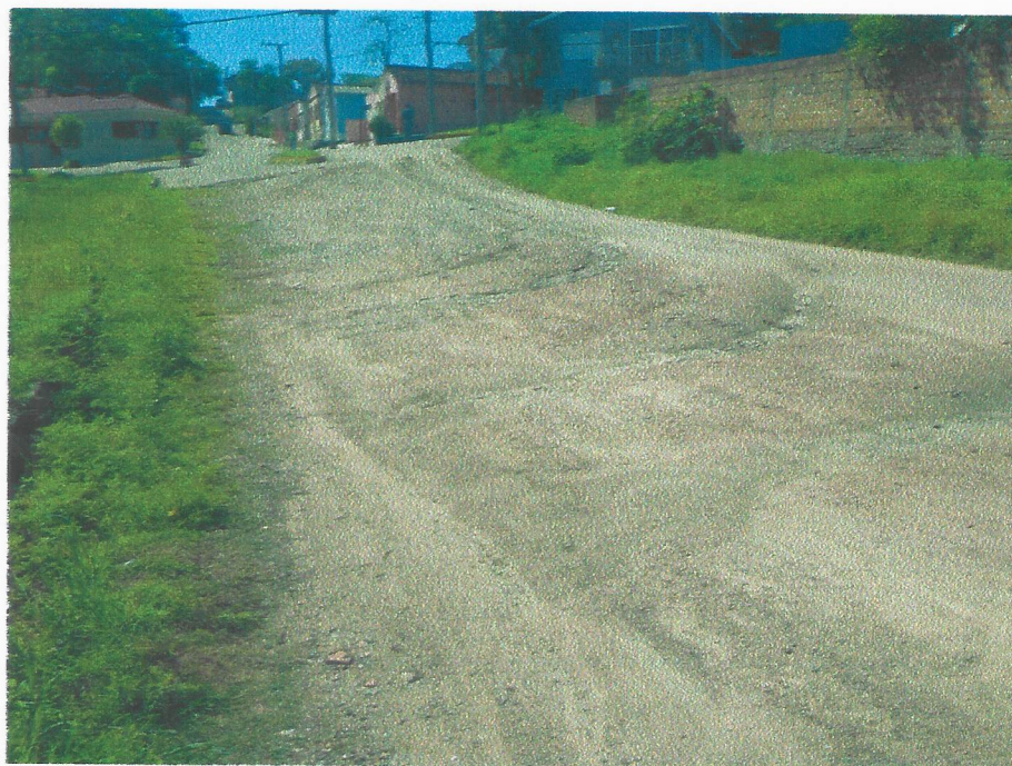
Rua 24 de Maio