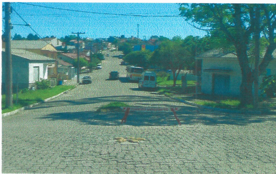
Rua Procópio Gomes de Freitas esquina 24 de Maio