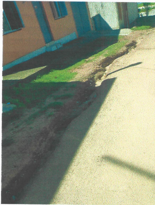
Rua Edu Pinheiro Gomes