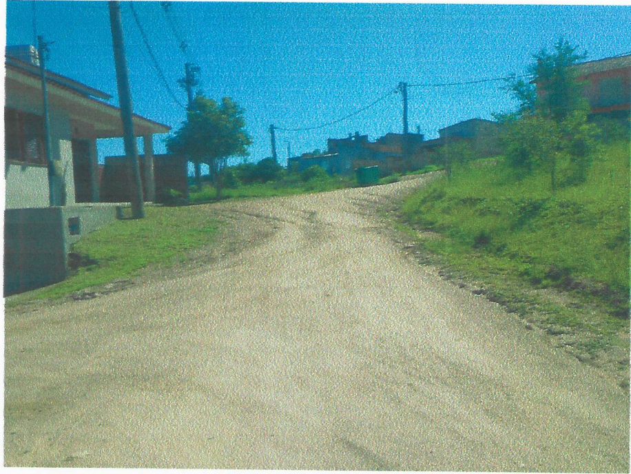
Rua Edu Pinheiro Gomes