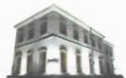
JOSÉ AURI SOARES Presidente Legislativo 2023