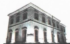
JOSÉ AURI SOARES Presidente Legislativo 2023